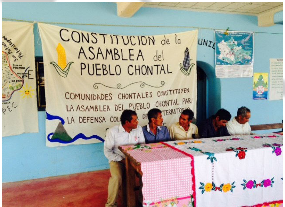
Los autoridades de San Jose del Progreso, Guerrero, San Juan Alotepec y Zapotitlan en la asamblea para la constitucion del pueblo Chontal, 25 de junio 2016, en Santa Lucia Mecaltepec

Estados Unidos Mexicanos reconoce los pueblos indígenas como "aquellos que descienden de poblaciones que habitaban en el territorio actual del país al iniciarse de la colonización" y, por lo tanto, reconoce sus derechos "a la libre determinación y la autonomía para (...) conservar y mejorar el hábitat y preservar la integridad de sus tierras". Por lo tanto, una articulación formal y colectiva de auto-adscripción es una herramienta jurídica muy importante frente a la minería, el gobierno u otras que